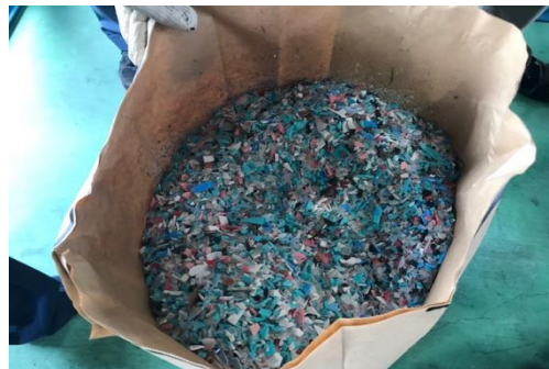
収集された製品プラと再生ペレットおよび物性値